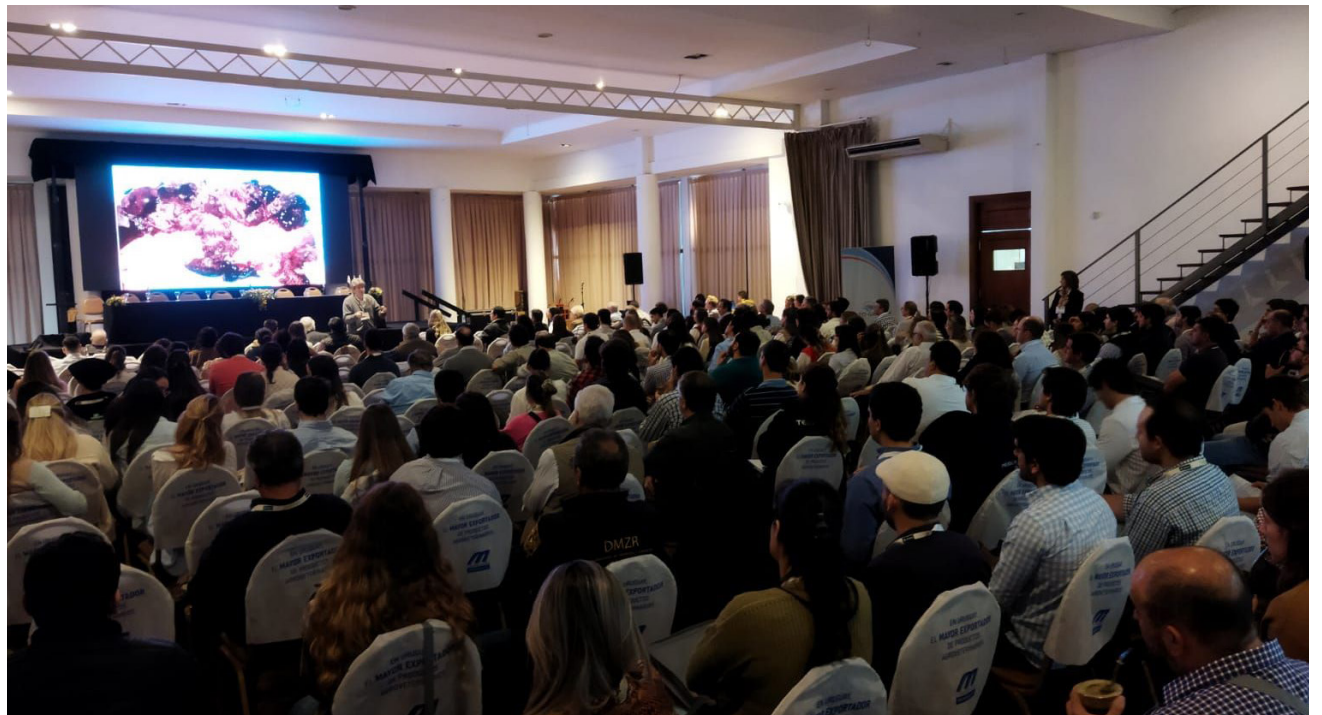
Jornadas Uruguayas de Buiatría, 2023

La profesional explicó que el concepto de “Una sola salud”, tan presente en los temas sanitarios nacionales, incluye la salud humana, animal y la del medioambiente: “Nos incluye a todos y la profesión veterinaria tiene un rol muy importante para cumplir en ese sentido”.