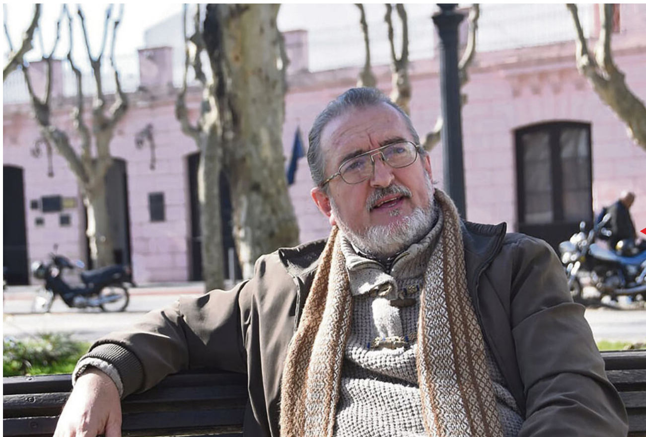
"Es indudable que vemos si sabemos. Para eso sirve el conocimiento: para ver"

"La sangre indígena que en alto porcentaje corre por las venas de los uruguayos, especialmente desde el centro hacia el norte del país, viene en su mayor parte de los indígenas misioneros, no de los nómades de las tolдерías"