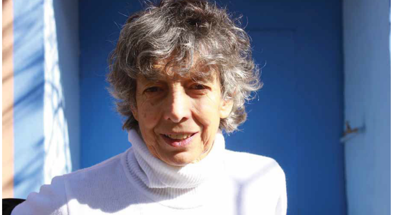
"Desde muy joven me tocó, también en la práctica, ser ciudadana del mundo"

Unos cinco años después, ya en Montevideo, fundaste tu propia compañía de danza. ¿Qué te llevó a hacerlo? ¿Sentías una fuerte vocación docen-