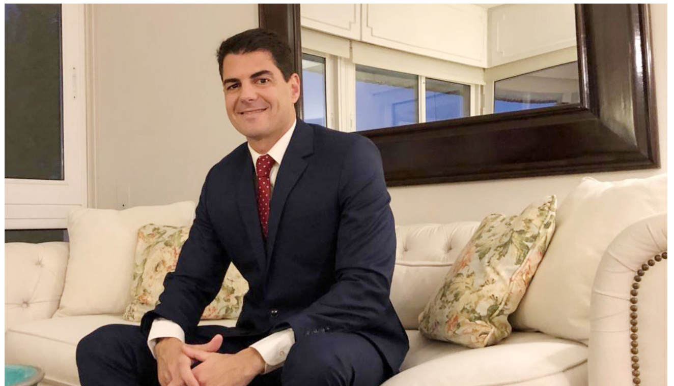
“Entendemos que es fundamental que haya un banco estatal que regule el acceso a la vivienda de las familias mediante el crédito hipotecario”

“El BHU tiene un rol en la sociedad que hace que no sea un banco comercial más, ya que integra el sistema público de vivienda y, como tal, cumple con el rol que le dio la sociedad, que es